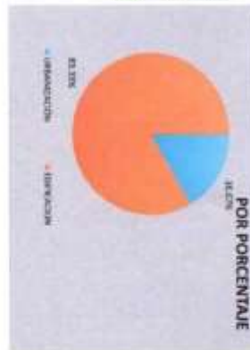
RECURSOS PICHOS 2025

441 277 00 96 / 441 277 07 07 / 441 277 52 31